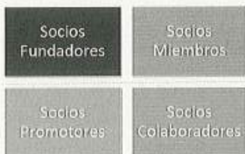
Imagen 1. Tipología de socios de la RIDAG.

A continuación, se detallan los aspectos que caracterizan cada uno de ellos: