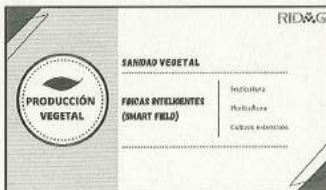
Imagen 2. Producción Vegetal – Grupos de Trabajo

La temática de Producción Vegetal está formada por dos grupos de trabajo (Imagen 2).