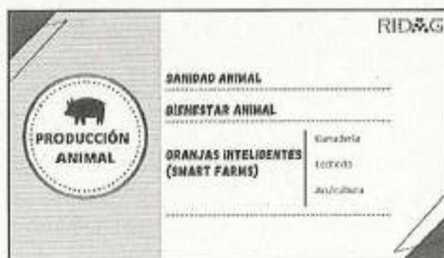
Imagen 3. Grupos de Trabajo – Producción Animal

La temática de Producción Animal está formada por tres grupos de trabajo (Imagen 3).